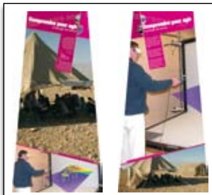
ENERGIES EN DEVENIR. Les enjeux de demain...