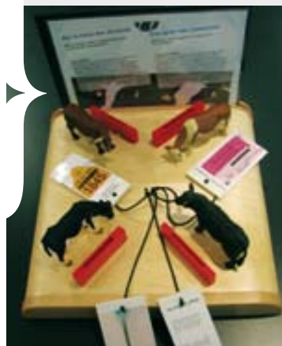
SUR LA TRACE DES ALIMENTS : retrouvez-vous l'étiquette qui correspond à chaque animal ?

Découvrir par l'image les nouvelles technologies en agroalimentaire