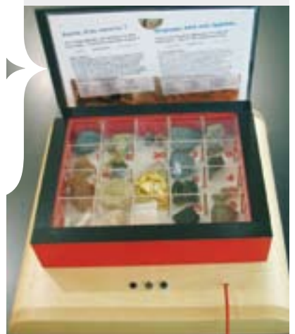
ROCHES IGNÉES, SÉDIMENTAIRES OU MÉTAMORPHIQUES. Retrouvez-vous l'origine de ces échantillons ?

(* ) Alimentation électrique nécessaire (220 volts)