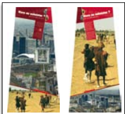
VIVRE OU SUBSISTER ? Pour un dollar par jour...