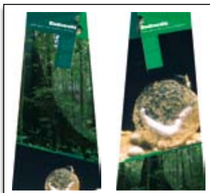
BIODIVERSITÉ, QUELLE GESTION des ressources naturelles ?