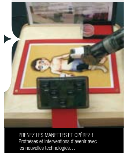
PRENEZ LES MANETTES ET OPÉREZ ! Prothèses et interventions d'avenir avec les nouvelles technologies...

(* ) Alimentation électrique nécessaire (220 volts)